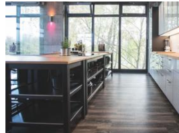
Hochwertig ausgestattete Küchenzeilen