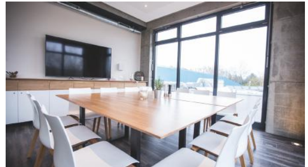
Unser modernes kochwerk 1 - mit großer Fensterfront

Unser kochwerk.berlin bietet Ihnen eine Location für jeden Anlass mit modernster Tagungstechnik. Sie haben die Möglichkeit aus vier verschiedenen Räumen den für Sie passenden auszuwählen. Gerne stehen wir Ihnen auch bei der Organisation Ihres Events von der Weihnachtsfeier bis hin zu Seminaren zur Seite. Unser vielfältiges Programm bietet Ihnen die Möglichkeit, Ihr Event mit sportlichen Aktivitäten, Kinderbespaßung in der Tobewelt, sowie mit Kochkursen zu kombinieren. Für das Catering Ihres Events stehen wir Ihnen ebenfalls gerne zur Seite.